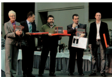
Primeros premios de las tres categorías

En el marco del certamen se celebró un showroom con la presencia de más de treinta bodegas de todo el territorio catalán, que ofrecieron sus vinos y cavas a todos los asistentes a lo largo de todo el acto. ☎