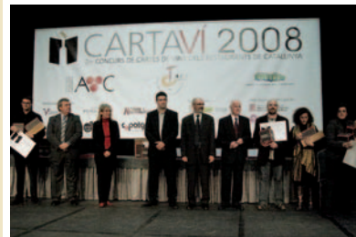
Segundos premios de los restaurantes de 30 a 49 €