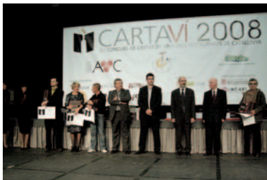
Terceros premios a los restaurantes de hasta 29 €