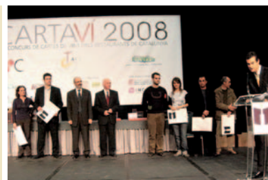
Restaurantes recomendados de hasta 29 €