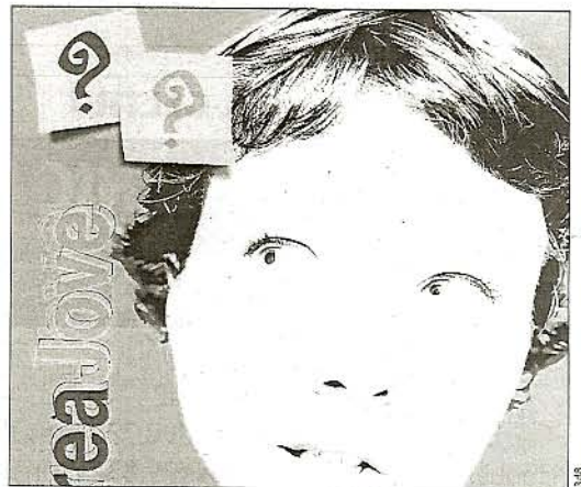
Cartell del concurs Creajove, que premia el millor projecte empresarial