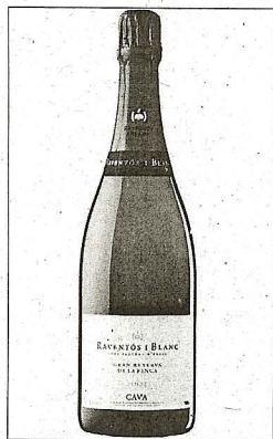
Josep M Raventós i Blanc Gran Reserva de la Finca

El Josep M a Raventós i Blanc Gran Reserva de la Finca, una de les medalles d'or, està elaborat amb un cupatge de 40% Xarel·lo, 20% Macabeo, 25% Parellada, 10% Chardonnay i 5% Pinot Noir. Amb una criança mínima de 3