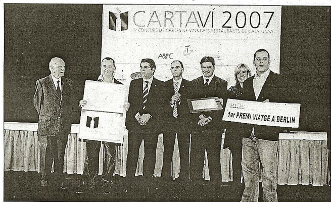
Cal Xim va guanyar el primer premi a la millor carta de vins de Catalunya

Cal Xim es va endur el primer premi a la millor carta de vins de Catalunya per davant d'establiments com El Bulli