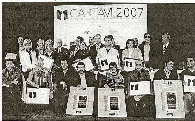
Foto de família dels guanyadors dels premis Cartavi