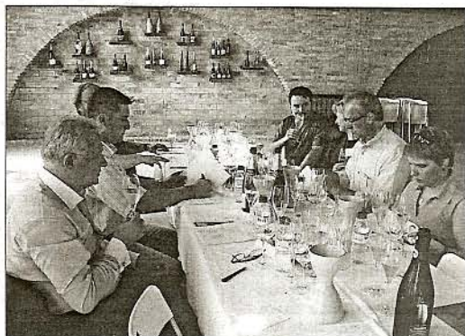
La delegació polonesa va poder tastar els productes als cellers penedescs

Destacar també el canvi d'hàbits. S'està reduint el consum de begudes d'alta graduació per a començar a gaudir del Vi. Mostra de tot això, és la proliferació de botigues especialitzades de Vins, i de productes d'alta gastronomia. Pel que fa a les grans cadenes de supermercats es comencen a destinar espais per a vins de qualitat mitja-alta, atesos per pro-