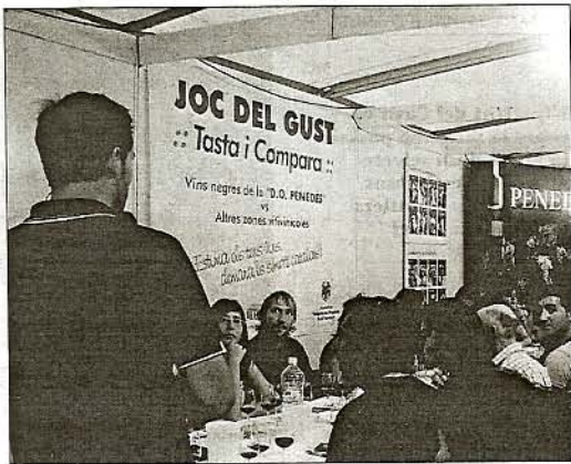
Els participants al 'Joc del gust' es decanten pel vi del Penedès

Un any més, l'Acadèmia Tastavins del Penedès va estar present a la Mostra de Vins i Caves de Catalunya que es va celebrar la setmana passada a Barcelona, amb un estand compartit amb la Unió Vinícola del Penedès (Uvipec) i el Consell Regulador de la DO Penedès, en el qual novament es va posar en marxa el ja conegut "Joc del gust", consistent en què el públic participant en les sessions -de mitja hora aproximadament cadascuna- indiqui únicament quin dels tres vins tastats "a cegues", és a dir sense que es vegi