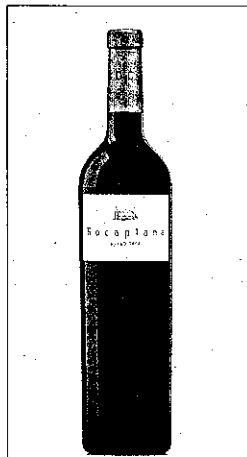
Rocaplana Syrah 2006

El Rocaplana Syrah 2006 és un vi negre de color cirera picota amb ribets violacis i de capa alta i abundant formació de llàgrima. Aquest vi té una intensitat