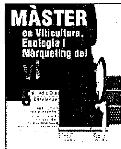
Cartell Màster en Viticultura

El curs té l'objectiu de fomentar la modificació d'actituds i modificar l'horitzó del coneixement dels participants per millorar la seva capacitat d'anàlisi en el seu entorn empresarial i laboral. Per aquest motiu, el curs toca àmbits diversos com ara els de la viticultura,