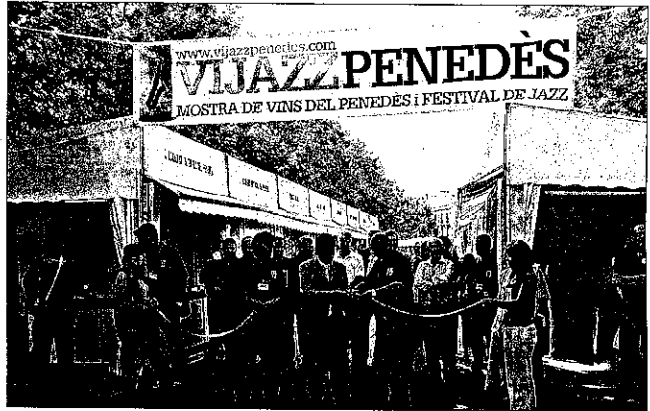
La inauguració de la mostra va suposar el començament d'un cap de setmana intens