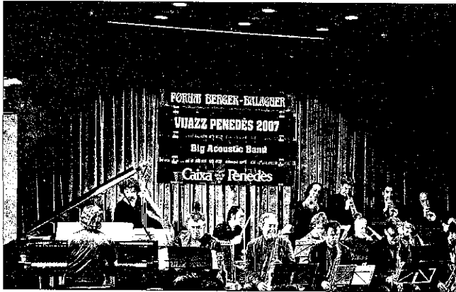
El concert de la Big Acoustic Band va engegar el Vijazz dijous a la nit

L'èxit rotund de la primera edició del Vijazz Penedès ha permès a l'organització tancar el certamen amb un marge de benefici