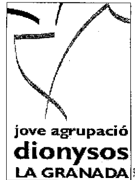
Logo de la Jove Agrupació Dionysos de la Granada

A més de la Mostra de Vins DO Penedès i Caves, la Jove Agrupació Dionysos aprofita el romanent de vi que queda d'aquest certamen per promocionar els vins de la