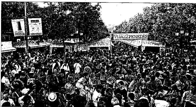
El Vijazz Penedès ha comptat amb la visita de 25.000 persones, moltes de les quals a la Fira

s'han omplert totes, per això, de cara a l'any vinent, intentarem muntar alguna estratègia per promocionar aquests recorreguts, perquè hem vist que hi ha un gran interès". Les visites als cellers de la comarca també han estat un del reclame més important dels visitants. Boada espera que "l'any vinent més cellers